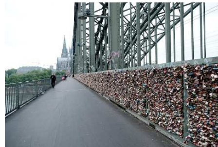
Hohenzollernbrücke mit Liebesschlössern